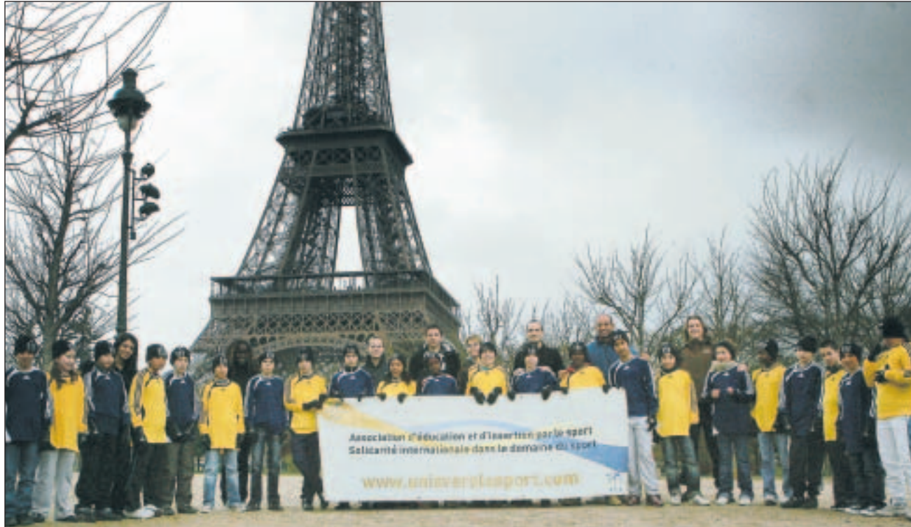
Un moment de fête pour les 22 jeunes du projet qui ont découvert le Stade de France pour la première fois.